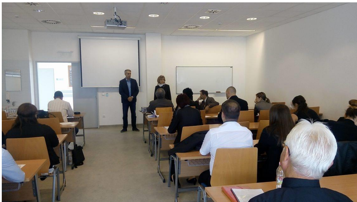
10. kép: Intézményi TDK konferencia – eredményhirdetés 1.