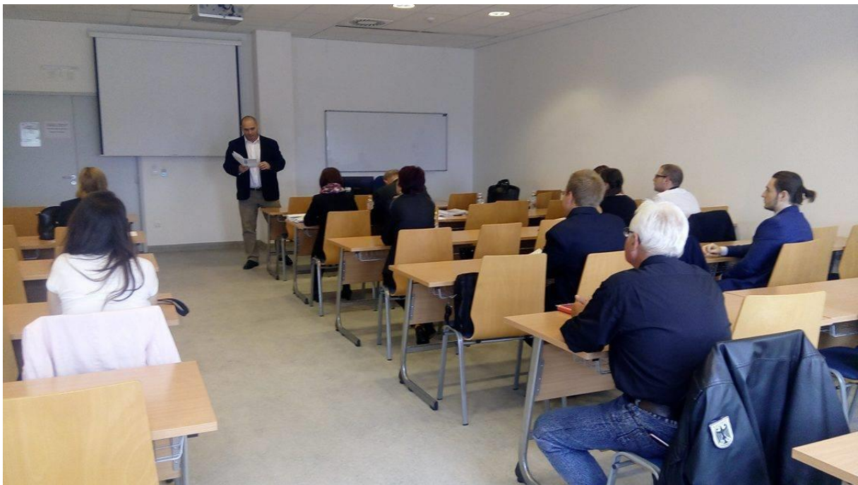
7. kép: Intézményi TDK konferencia – Vidékfejlesztési Szekció