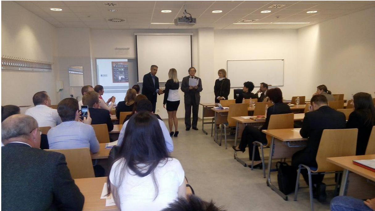
11. kép: Intézményi TDK konferencia – eredményhirdetés 2.