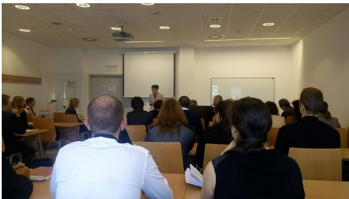
6. kép: Intézményi TDK konferencia – megnyitó