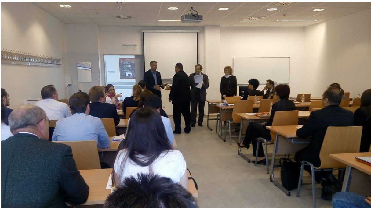
12. kép: Intézményi TDK konferencia – eredményhirdetés 3.